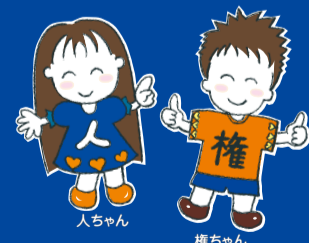
野洲市企業人権啓発推進協議会 イメージキャラクター

特に採用や職場環境の面で人権尊重の取組みが求められています。滋賀県では採用応募者の適性と能力に基づく公正な採用選考システムの確立が図られることや、研修・啓発の推進では人権が尊重される職場づくりに向けた取組みが行われるよう、7月に「なくそう就職差別 事業所内公正採用・人権啓発推進月間」とし、啓発活動を県内一斉に実施しています。