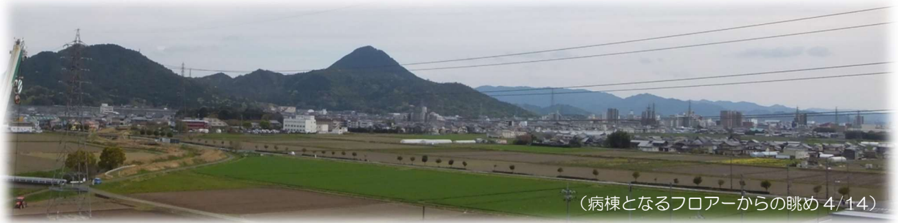
(病棟となるフロアーからの眺め 4/14)

今回の視察会では、病棟となるフロアーからのすぐれた景観も確認できました。4階から6階までの各病棟から南方面では、美しい三上山を望むことができました(上の写真)。また、北方面を望むと、比良・比叡の山並みや、うっすらと琵琶湖の湖面を見ることもできました。ふるさとを望める静かな場所で、野洲市民・患者さんが、落ち着いた心持ちで安心して療養し、リハビリや治療に取り組んでいただけることと思います。