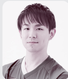
丹羽孝希選手 （元オリンピックメダリスト）