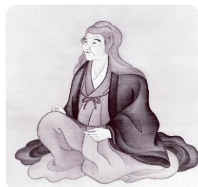
北村季吟画像（季吟文庫蔵、江戸時代）