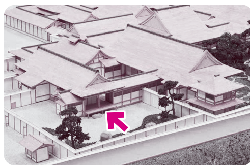
永原御殿復元模型(銅鐸博物館2階常設展示) 本丸「御休息所」(矢印の建物)