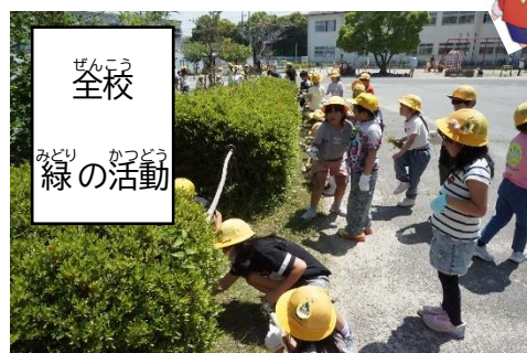
全校 みどり 緑の活動