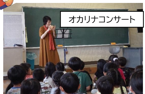
オカリナコンサート