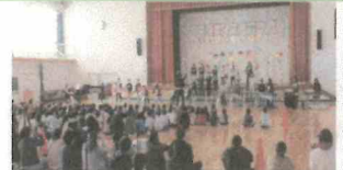
わくわくコンサート