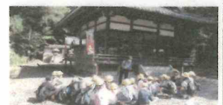
地域を知るたてわり遠足