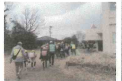
スクールガードさん「よろしくお願いします」「いつも見守りありがとうございます」