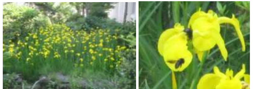
しょうがっこうしょうめんげんかんよこ 【小学校正面玄関横 しのたけどうそうかいていえん 篠竹同窓会庭園のキショウブ】