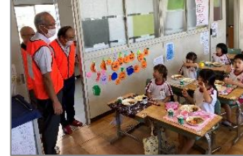
読み聞かせひまわり隊