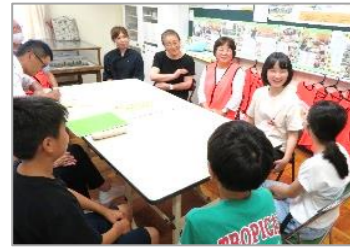
祇王っ子ひまわり隊