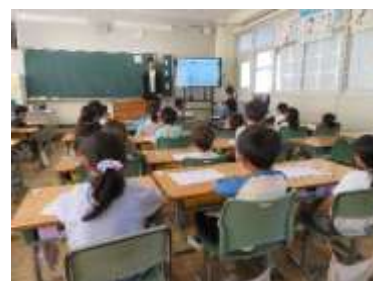
は っ ぴ ょ う し ゃ み き ね ん せい 発表者を見て聴く、1年生

は じ め て の が っ こ う せ い かつ す こ な ね ん せい こ く 語 はじめての学校生活にも少しずつ慣れてきた1年生。国語 か 科 では、ひらがなの が っ こ う せ い かつ が っ こ う せ い かつ 科では、ひらがなの学習がはじまっています。学 習 し た ひ ら が な を つ か こと ば あ つ は っ ぴ ょ う し ゃ か お み ら が な を つ か こと ば あ つ は っ ぴ ょ う し ゃ か お み を使った言葉集めをしています。発 表 者 の 顔 を 見 て、 き 聴 く こ と を い し き な か ま たい せ つ よ う す み 聴くことを意識するなど、仲間を大切にしている様子が見ら れます。また、よ し せ い え ん ぴ っ ち か た た し し ん け ん また、良い姿勢で、鉛筆の持ち方を確かめ、真 剣 な ま な ざ し で 書 い て い ま す。ど の こ も と て も は り き っ て い る よ う す 様子が 見 ら れ、ほ ほ え ま し い で す。