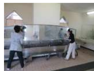
てあら ば そうじ 手洗い場を掃除する6年生