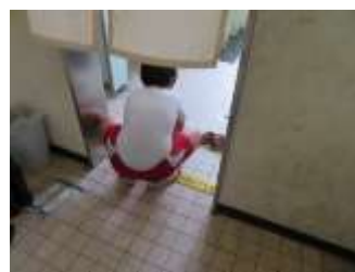
トイレのスリッパをそろえる5年生

ちなみに、先日の自治会長会で地域ぐるみのアルマジロ運動への協力をお願いしたところ、皆さん快く賛同していただきました。今後、アルマジロ委員会を中心に各自治会館にアルマジロ運動推進の「のぼり旗」を持って寄せていただく予定です。家庭、地域でもアルマジロ運動にご協力いただきますようお願いいたします。