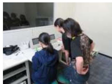
1日の予定を伝える放送委員会

新しい取り組みや楽しいアイデアをどんどん出して「どんどんチャレンジ」する姿を応援し、後押ししていきます。