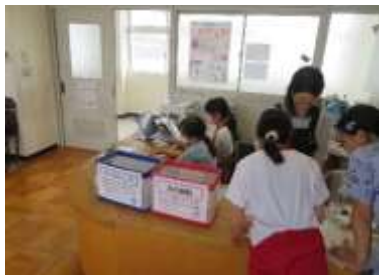
しおりを作る図書委員会