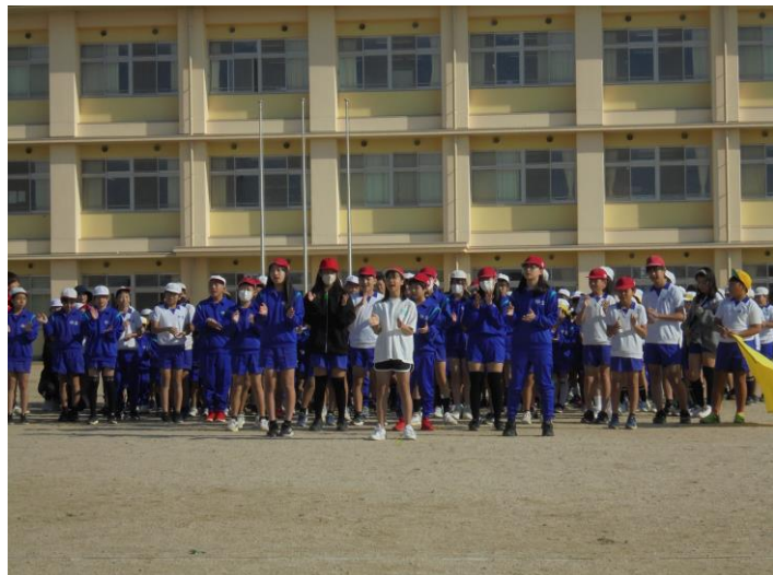
運動会 5・6年生の リーダーシップ。