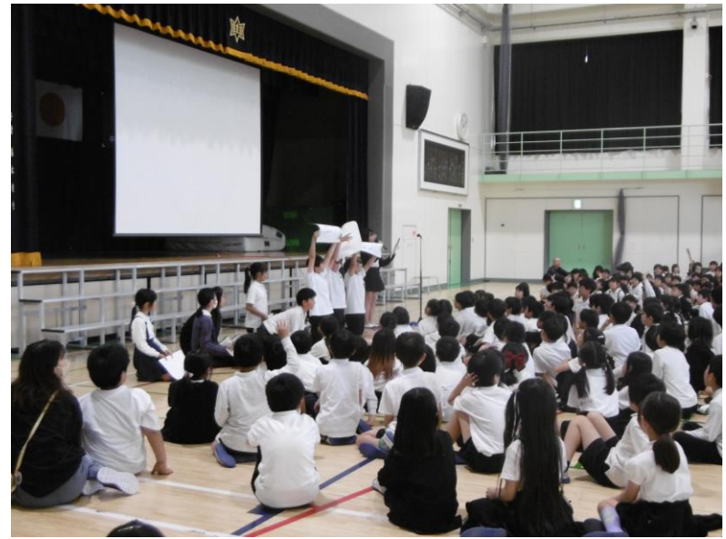
中主っ子集会(よりよい学校にするために主体的に考える取組)