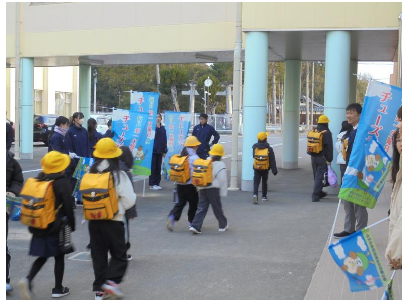
チュウズデーの様子