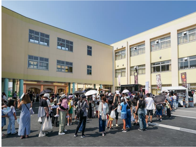
「おいでやす中主小フェア」