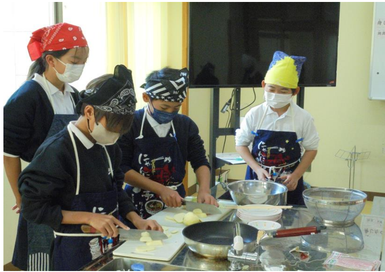
仲間と協力して取り組む活動