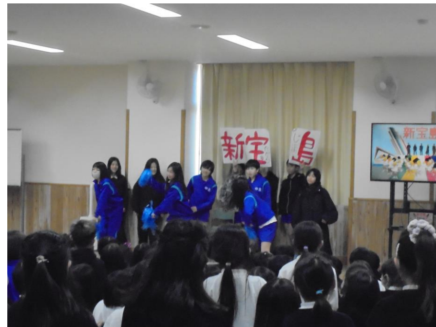
子どもたちが企画 チャレンジ発表会