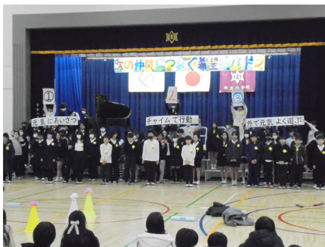
6年生の発表 「六年間のありがとう」