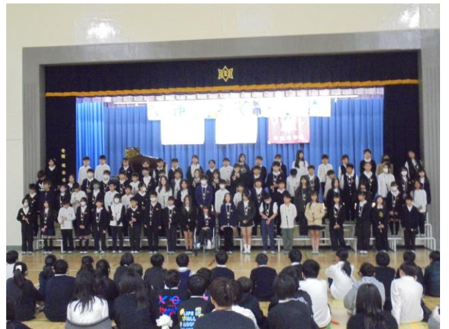
5年生の発表 「5年生の想い～虹に乗せて届け～」