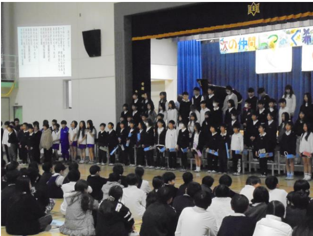
4年生の発表 「六年生、イイじゃん！」