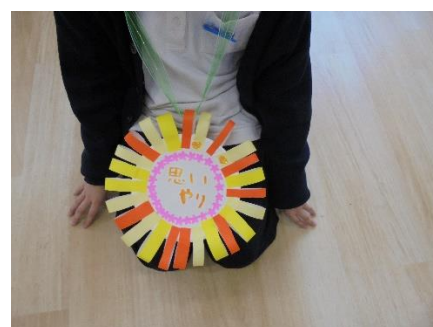
3年「思いやり」のバトン