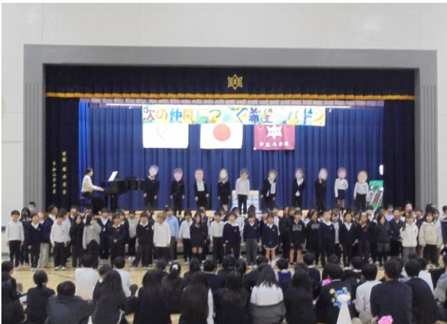
2年生の発表「バックトゥザフューチャー あの頃に帰ってみよう」