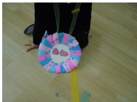
1年「あいさつ」のバトン

3月4日(水)に引継ぎ式をしました。今まで学校のリーダーとして務めてきた6年生から、5つのバトンを引き継ぎました。「これからの中主小学校をよろしく！」と思いを込めて…。