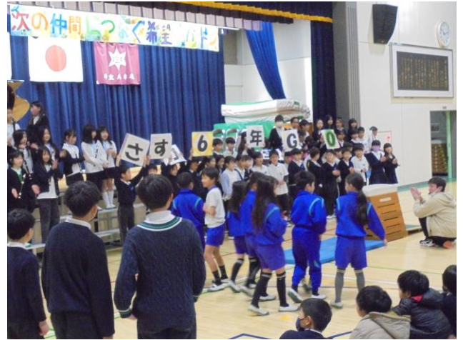
3年生の発表 「チャレンジ GOOD DAY！」