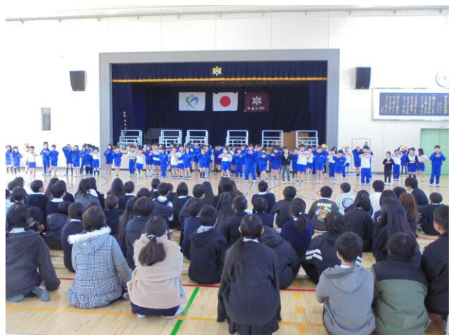
1年生の発表 「ありがとうの気持ち あふれMAX」