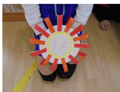
5年「リーダー」のバトン