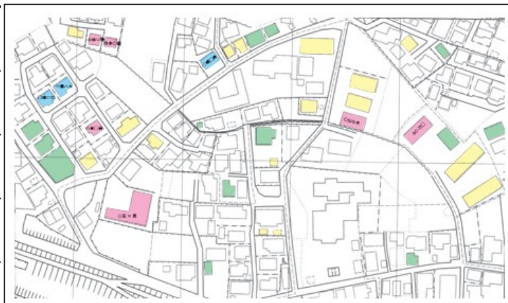
見守りリスト(イメージ)