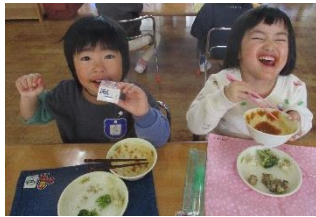
きゅうしょく 給食おいしいな!