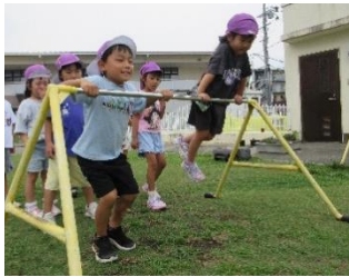
てつぼう 鉄棒にチャレンジ