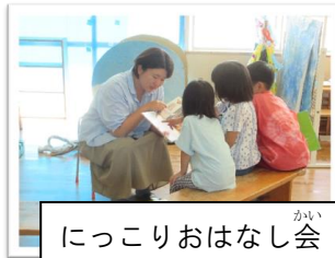
にっこりおはなし会