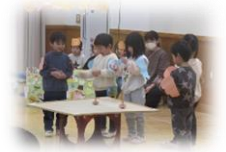
せいかつはっぴようかい 生活発表会