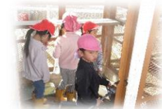
5歳児が4歳児に 「うさぎ小屋のそうじ」を伝えます