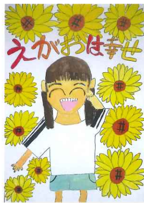
しのほらしょうがっこう 4年 長尾 美咲樹