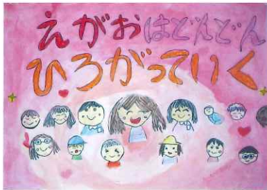
みかみしょうがっこう 3年 東川 華音