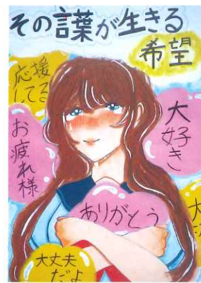
ちゅうずちゅうがっこう 2年 矢野 愛美花