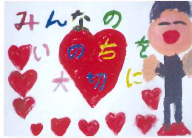
ぎおうしょうがっこう 2年 権藤 瑞希