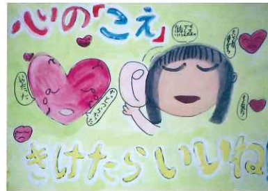
ちゅうずしょうがっこう 5年 中島 育枝