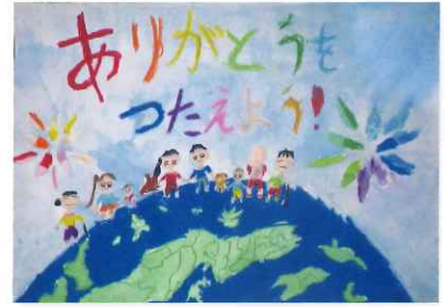
やすしょうがっこう 2年 上原 一華