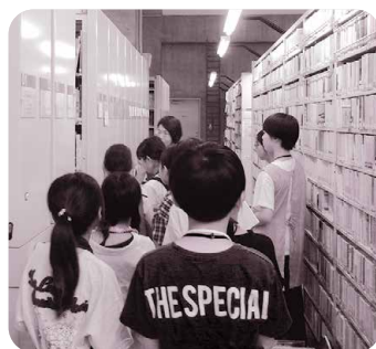
◀書庫を案内します