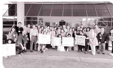
▲第23回滋賀県ミシガン州友好親善使節団派遣の様子