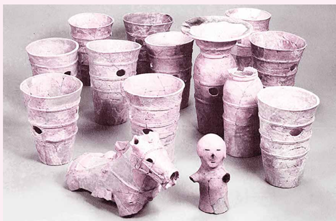
馬形埴輪・人物埴輪（御明田一号墳）