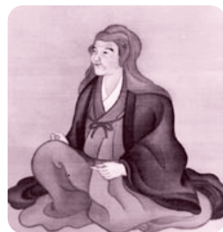
北村季吟（1624～1705） [季吟文庫蔵]