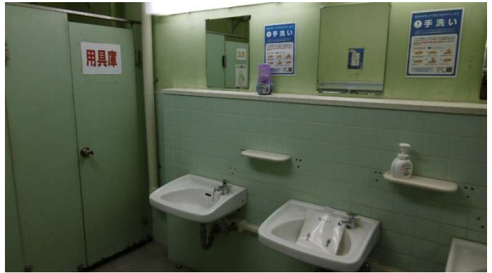
ソーシャルディスタンスの確保