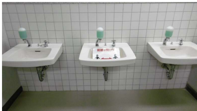
ソーシャルディスタンスの確保