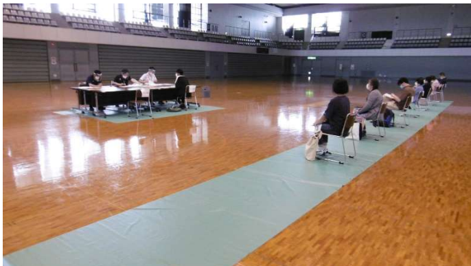
3密回避（更衣室使用停止・施設受付風景）