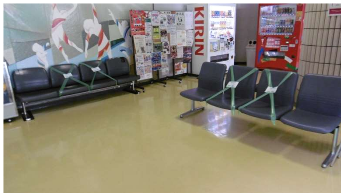
総合体育館ロビー（ソーシャルディスタンスの確保）