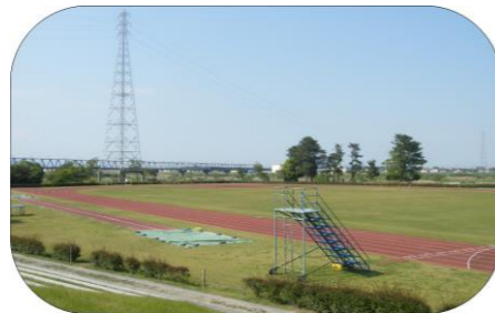
野洲川運動公園 陸上競技場