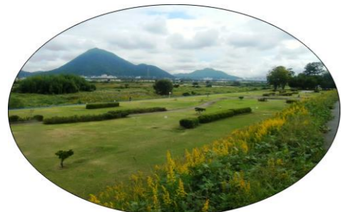
野洲川立入河川公園 グラウンドゴルフ場