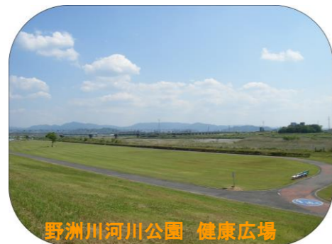
野洲川河川公園 健康広場