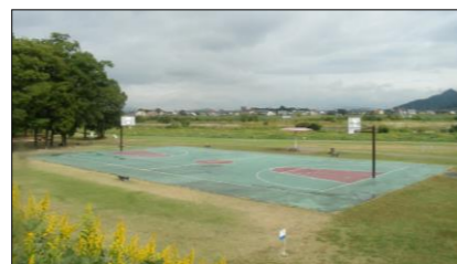
野洲川立入河川公園 バスケットボール場