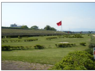
野洲川運動公園 ローンプレイフィールド