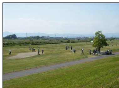
野洲川河川公園 グラウンドゴルフ場