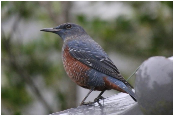
※野洲市民提供(市内で撮影)