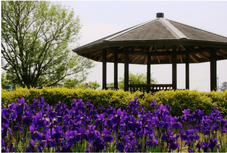
※野洲市吉川地先アイリスパークにて撮影