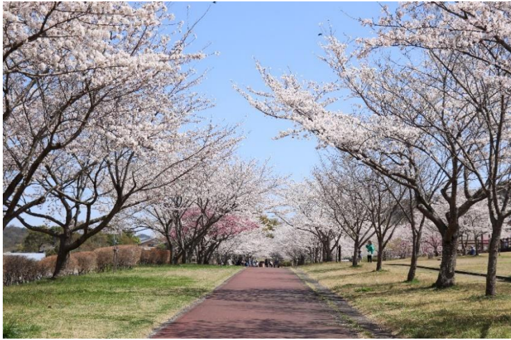
※野洲市南櫻地先さくら緑地にて撮影