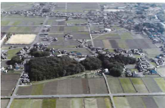
▲北西側の上空から見た永原御殿跡