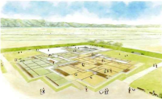
▲史跡永原御殿跡 本丸部分の整備イメージ