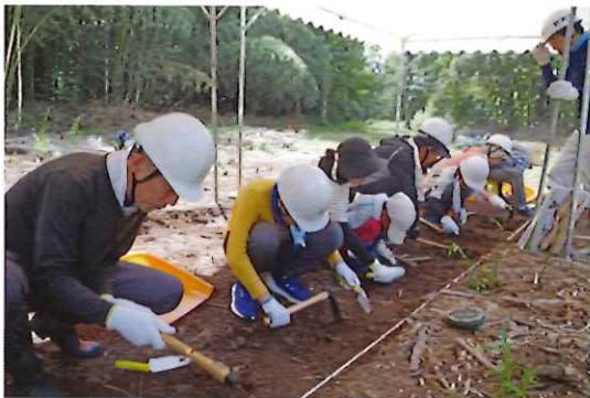
▲令和5年度 夏休み！永原御殿跡の発掘調査体験教室