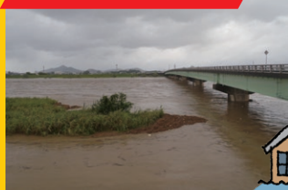
※平成25年台風18号時の状況