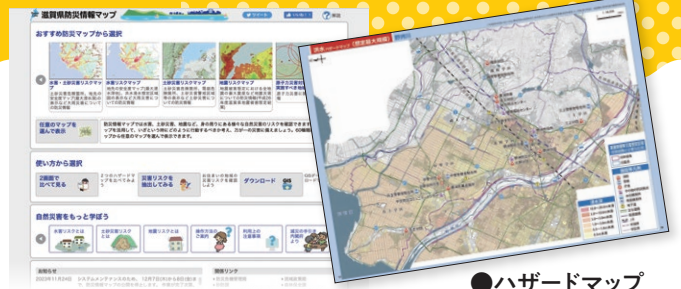
●ハザードマップ ってなに?