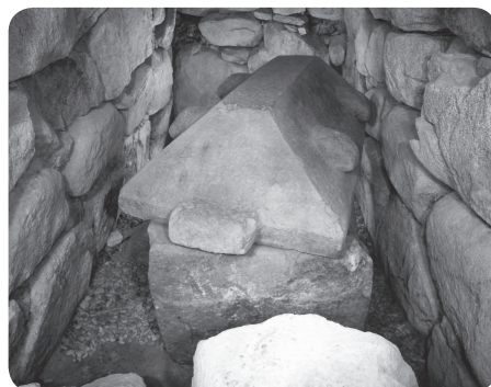
甲山古墳 横穴式石室と家形石棺