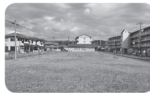
上屋字見星寺1372番68 他