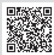
友だち追加はこちら