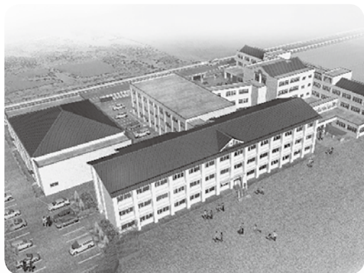
中主小学校完成イメージ