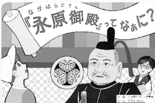
国史跡PR用紙芝居 (表紙)