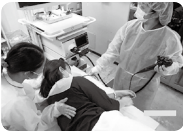
▲検査中は看護師が優しく介助します

▽胃カメラ…胃カメラを飲んで食道・胃・十二指腸の粘膜異常をチェックします。異常があれば粘膜採取してさらに詳しい検査をします。