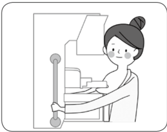
▲マンモグラフィ検査

▽乳腺超音波検査（乳腺エコー）…乳がんや乳腺炎などを超音波画像でチェックします。