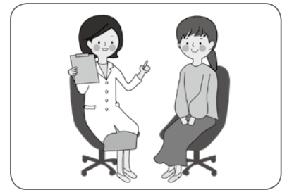
▲検査後、医師より結果説明があります