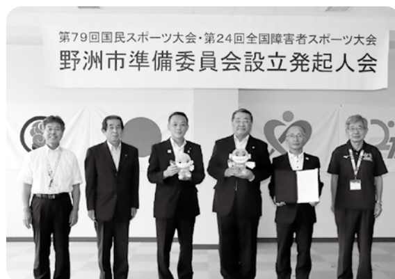
（左から） 教育長、商工会長、市議会議長、市長、スポーツ協会長、副市長