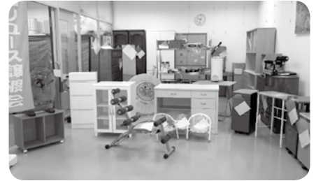
常設展示のイメージ