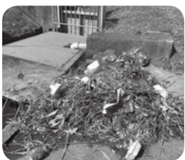
水路に投棄されたゴミや枯草

野洲川下流土地改良区 ☎ 589-8222、野洲川土地改良区 ☎ 0748-621154