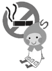
滋賀の健康づくりキャラクター 滋賀のハグ

※令和2年度は当検診を中止していたため、今年度に限り、令和2年度中に55・60・65・70・75歳になった人も対象に含みます。 ※COPD質問票の返送期限は8月末です。