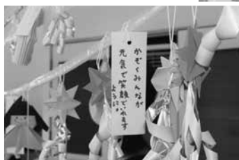
▼7月7日 あやめ子育て支援センター