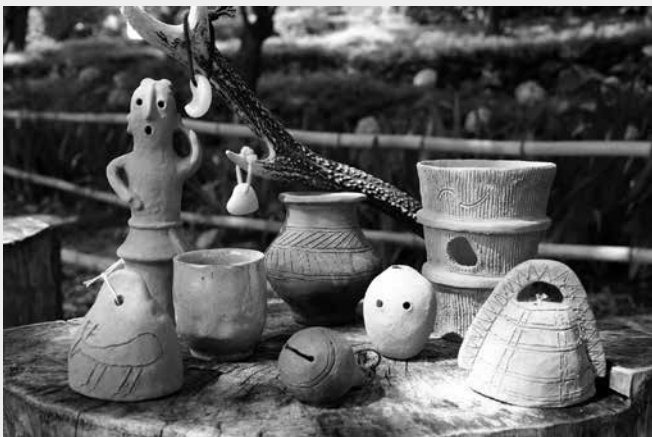
弥生の森体験学習での作品