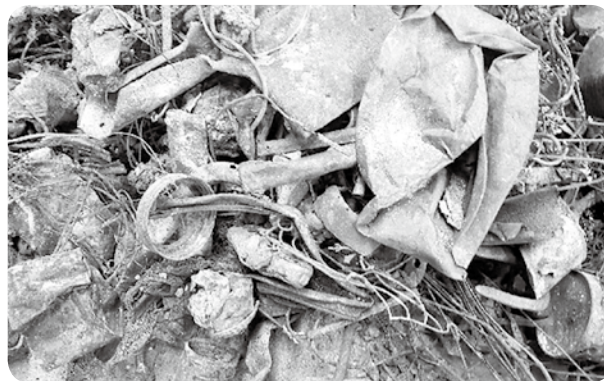
混入されていた空き缶や針金など

このような事象が繰り返されないよう、ごみを出される際には、適正なごみの分別を行い排出するよう協力をお願いします。