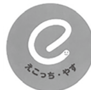
エコっち・やす 「エコ資源部会」