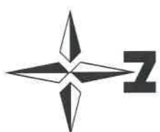
農用地等保全整備状況図 (附图3号)