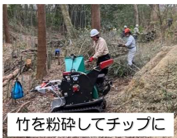
竹を粉碎してチップに

平野部の貴重な緑地である市三宅地先の野洲川北流跡自然の森の竹伐採、散策路や広場整備、実生樹木の育成など保全活動を行っています。地域の憩いの森、子ども達が身近で自然に触れ合える森として次世代に引き継ぐことを目指して活動しています。