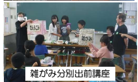
雑がみ分別出前講座

9月14日、雑がみ分別回収やごみ減量を啓発することを目的に、三上小学校4年生に雑がみ分別出前講座を行いました。児童からは「家でできるように家族に伝えたい」や「ごみの少ない街にしたい」などの感想がありました。みなさんもおみの分別や減量に取り組んでくださいね！