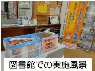
図書館での実施風景

7月21日～31日に市役所と野洲図書館で、フードドライブを実施しました。合計211点、重さで63kgもの食品が集まりました。集まった食品は、子ども食堂や市家庭児童相談課に寄贈しました。この取り組みを広げ、更なる食品ロスの削減に取り組んでいきたいと考えております。