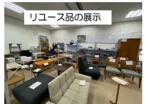
リユース品の展示