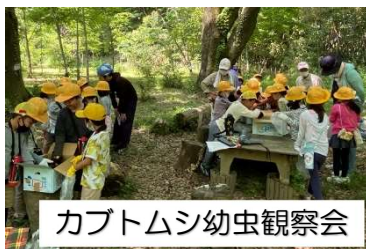
カブトムシ幼虫観察会

5月には北野小学校の2年生のカブトムシ幼虫観察会、森探索、及び4年生の森探索、6月には市内子どもたち対象のタケノコ採り、焼きタケノコ体験、また地域の「自然の中で子育てされているママさんグループ」との森での交流会、子ども会の森探索など、子どもたちが自然を体感できる機会を提供しています。