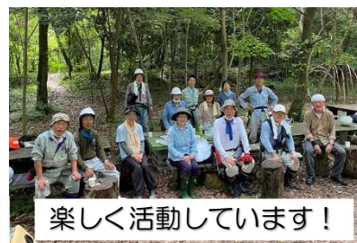
楽しく活動しています!