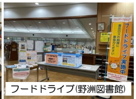
フードドライブ(野洲図書館)