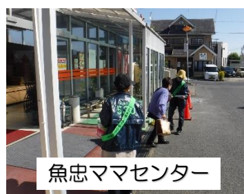
魚忠ママセンター

10月の3R推進月間及び食品ロス削減月間にごみを減らそうプロジェクトと市が共同で、買い物バッグ持参及び食品ロス削減を呼びかける「環境に優しい買い物キャンペーン」を市内小売店舗で実施しました。ポケットティッシュやチラシを配布し、買い物バッグ持参、家庭でできる食品ロス削減対策を呼びかけました。