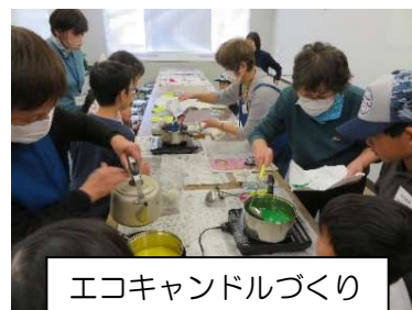
エコキャンドルづくり

コミセンやすで活動している小学生 13名と廃食油からエコキャンドルづくりのワークショップを実施しました。また、その保護者に廃食油のリサイクルに向け、回収を呼びかけました。