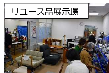
リユース品展示場