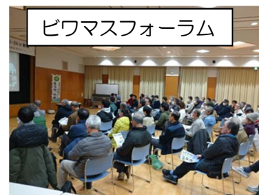
ビワマスフォーラム

これまでのビワマスを戻すプロジェクトの活動内容や成果および課題の報告と他地域の取組みを紹介するとともに、参加者と一緒に滋賀県全域へビワマス保全の輪を広げることについて意見交換を行いました。