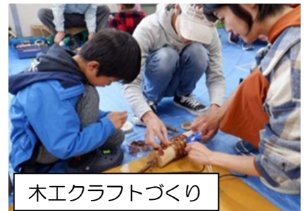
木エクラフトづくり