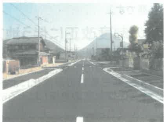
都市計画道路整備