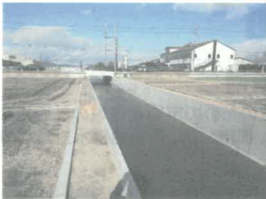
都市排水対策(雨水幹線整備)