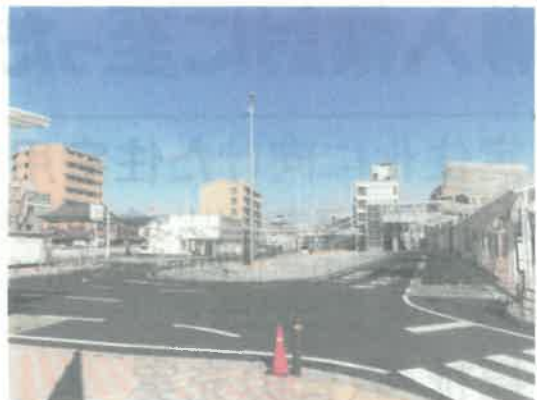
交通施設整備(駅前広場整備)