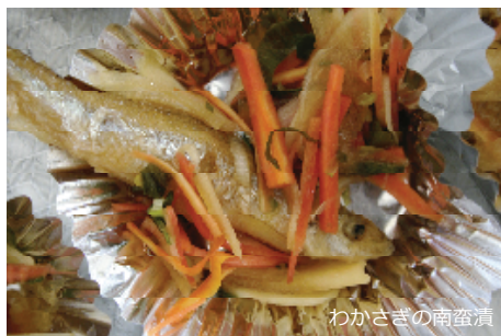
わかさぎの南蛮漬