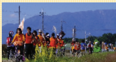
10/19 びわこ一周オレンジリボンたすきリレー（びわこマイアミランド）