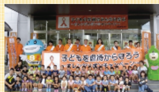
10/9 キャラバン隊メッセージ伝達（野州市役所）