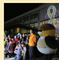
11/27 滋賀の夜空に オレンジリボン （野州市役所）