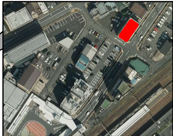
野洲市北野1丁目13-20 三甲ビル1階