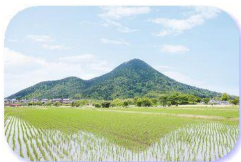
勇壮な“三上山（近江富士）”

さらに琵琶湖、野洲川をはじめとした水源に恵まれ、肥沃な土地を生かして古代から稲作が盛んで、近代化に向けた農業の振興と美しい田園風景保全の取り組みがされています。