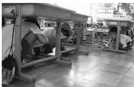
小学校での避難訓練

問 市内全ての幼稚園・学校で消防計画を定めており、避難方法、場所、教職員の指示、行政機関との情報交換についても定め訓練を行っている。保護者との情報交換・