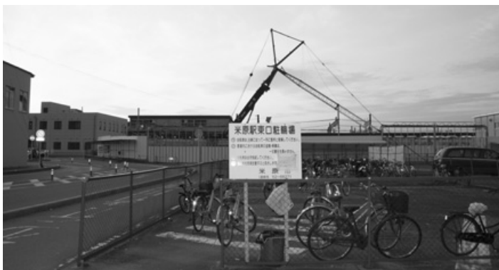
J R 米原駅東口周辺