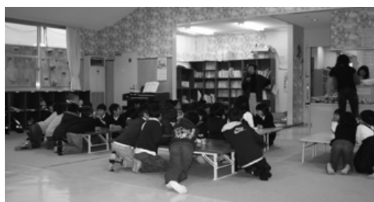
学童保育所ひまわりハウス