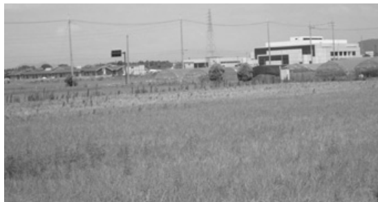
新給食センター予定地のはずが！

含め、お詫びし協議を行なっている。今後遊休地も含め調査、選定して建設に支障のないようにしたい。