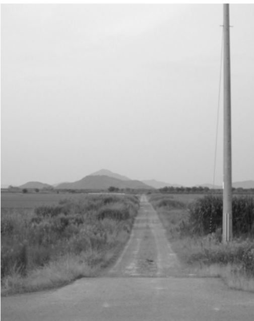
大津湖南幹線道路予定地

答 ご指摘のとおり湖南地域の重要な幹線道路であり、本市の今後のまちづくりの根幹道路である。平成13年度から比留田地先200mについて着手し、供用開始され、残る本線は両側排水溝、路床工を400m施工、本年度も計画(150m)されており、未供用である。本市は、当面、野洲中主線から小比江童子川線区間約1.4kmについて、早期の整備を強く要望したい。また、除草等環境整備も、県に強く要望したい。