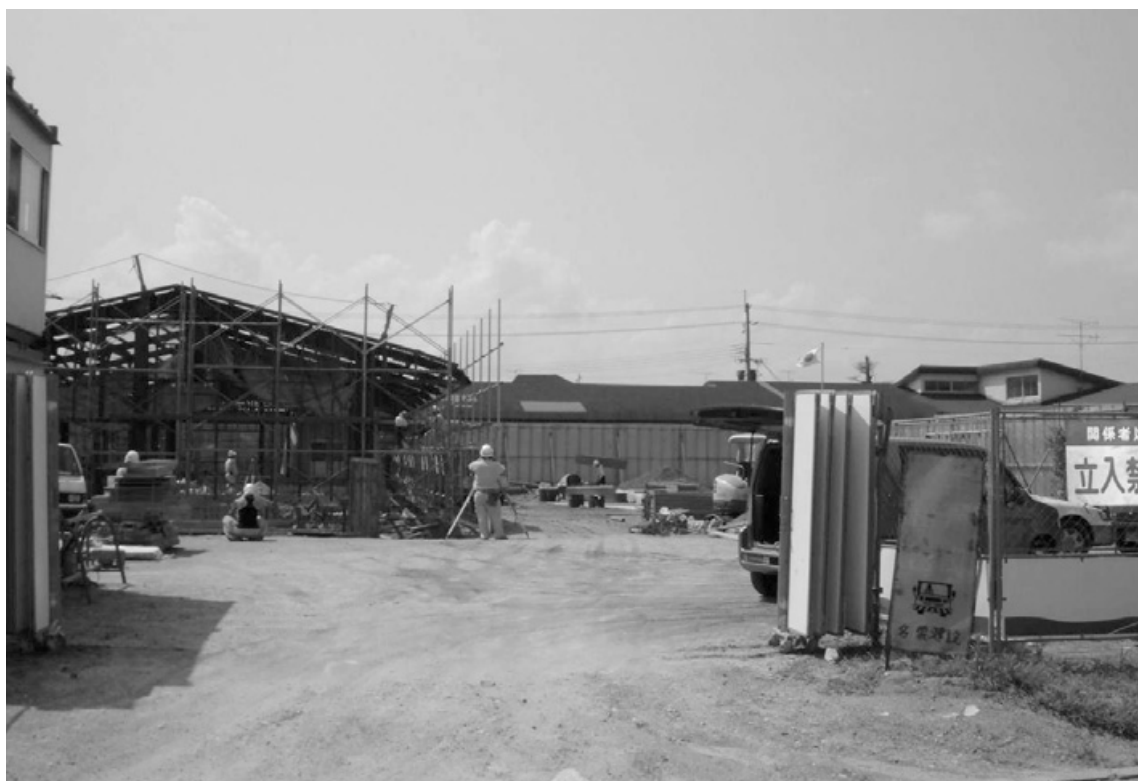
増築中の祇王幼稚園

6月定例会は9日開会、専決処分、条例の制定・一部改正、17年度一般会計補正、固定資産評価委員の選任、損害賠償、計17議案が提案され、審議の結果原案通り可決承認または同意し、16日、17日、20日に一般質問が行われ、23名の議員から質問があり、29日に閉会しました。