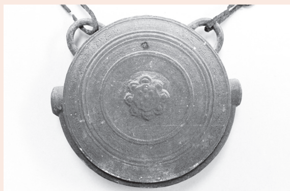
鰐口 1口(北桜自治会蔵)