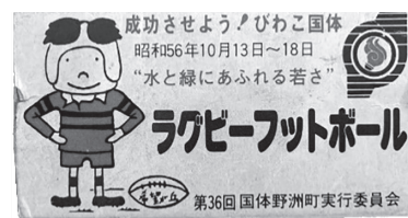
▲当時配布された大会記念マッチ