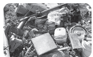
水路に投棄されたゴミや枯草